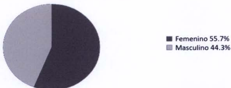
Distribución por Género

En relación al origen o tipo de discapacidad, se pesquisó que la discapacidad de mayor prevalencia es la de origen físico (56.98%), seguida por la de origen mental (27.35%), sensorial (12.25%) y, finalmente, origen múltiple o multidéficit (3.42%).